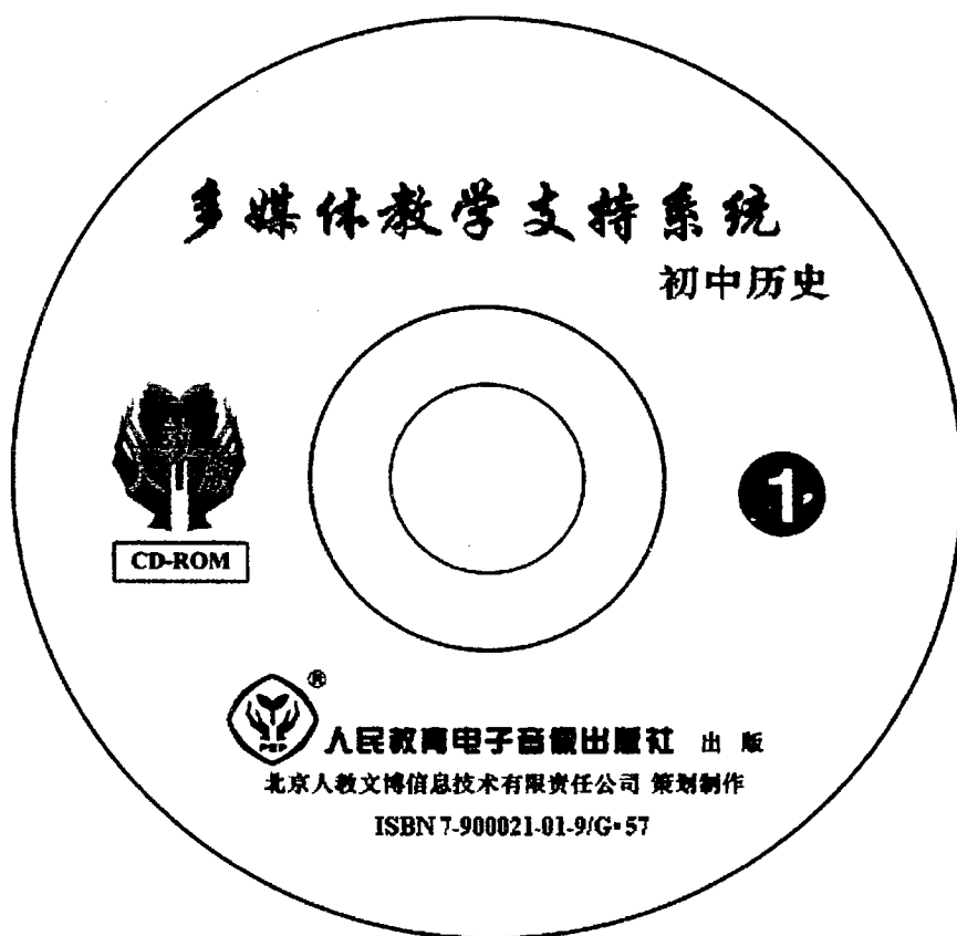
图 D1 光盘电子出版物媒体标识面印刷格式示例